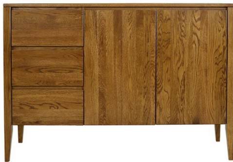
ART. DM-KD319 szuflady po stronie lewej

Lekki w formie i praktyczny mebel do aranżacji wnętrz stylizowanych w duchu trendów retro, vintage oraz modern retro. Ze względu na znaczny rozmiar, komoda może stanowić centralny punkt wystroju salonu lub pomóc w uporządkowaniu strefy przechowywania w większym przedpokoju lub w sypialni.